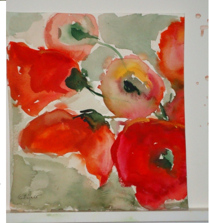
Vallmo; Fra utstillingen Damenes verden 2012